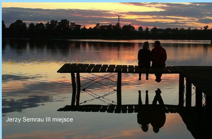
Jerzy Semrau III miejsce