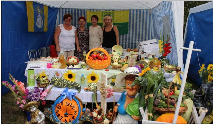
ROD Jana Kilńskiego