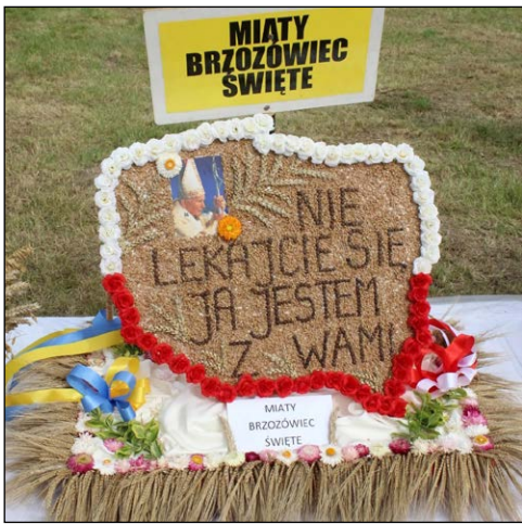
Miąty Brzozowiec Święte