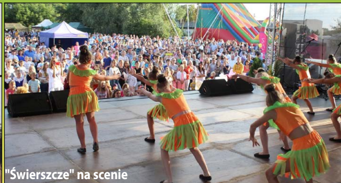
"Świerszcze" na scenie