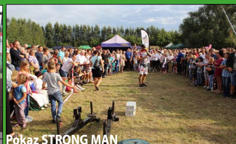
Pokaz STRONG MAN