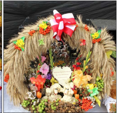
ROD im. Jana Kilińskiego