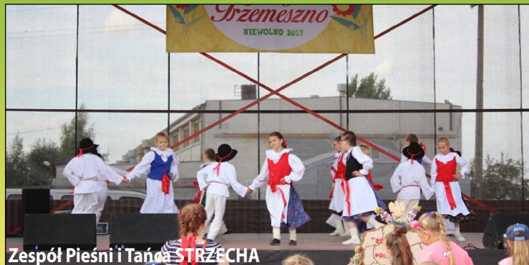
Zespół Pieśni i Tańca STRZĘCHA