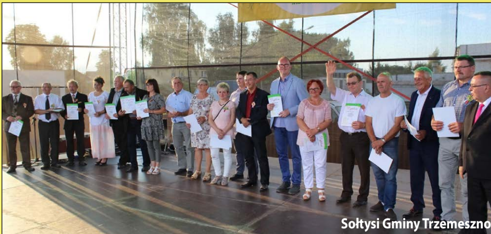
Sołtysi Gminy Trzemeszno