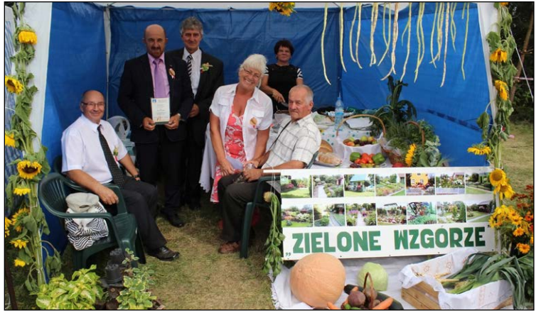
ROD „Zielone wzgórze”