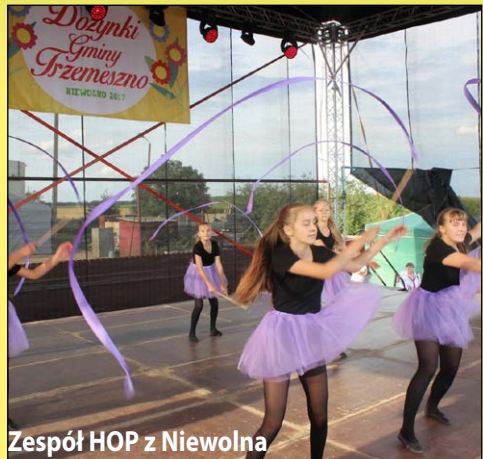
Zespół HOP z Niewolna