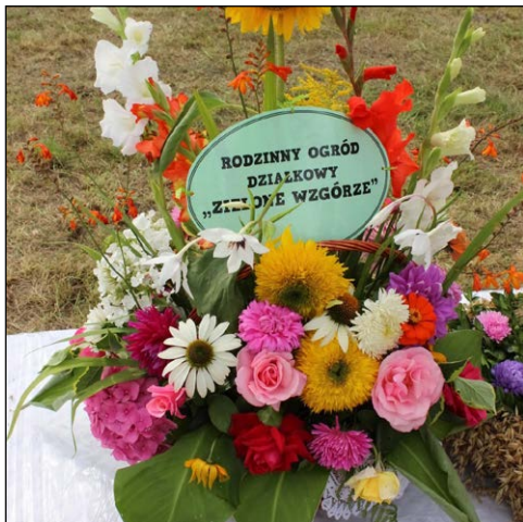
ROD Zielone Wzgórze